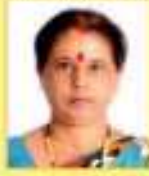
પઠાણ વાલમ્બેલ બી.