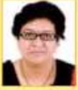
દેસાઈ સર્વે કે.