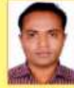
સાલોડ સરેશ ડી.