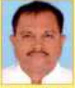
પઠાણ સહકારી કુ.