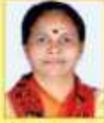
ભોજા ડી. પુષ્પ સાર.