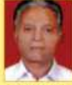
પટેલ સમુલ સોન.