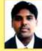
સાલ દિલેશ એસ.