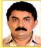
ઉપનયુક્ત સહકારી ઈન્સિદ કુ.