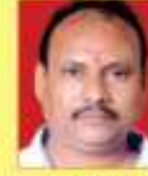
પટેલ ભટ્ટ ડી.