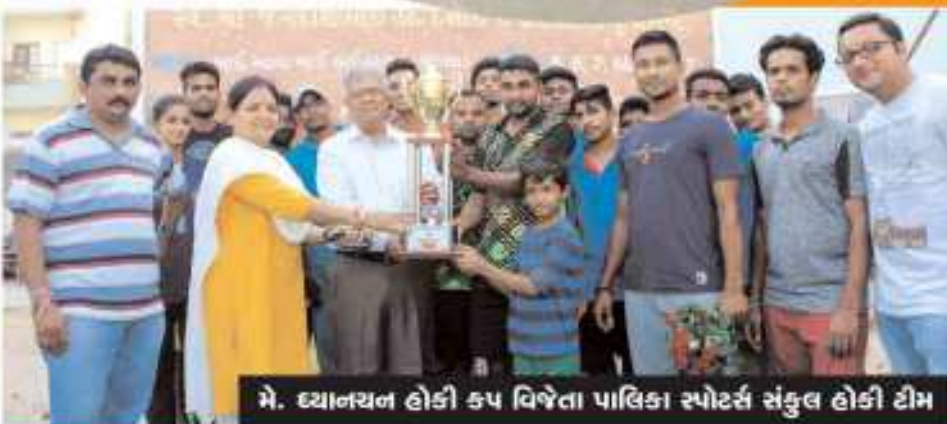
મે. ધ્યાનચન હોડી કપ વિજેતા પાલિકા સ્પોર્ટ્સ સંકુલ હોડી ટીમ