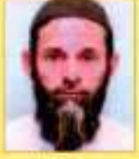
સાલોડી સંકેશ સહકારી