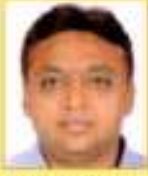
સાલ સર્વિન પદુમન