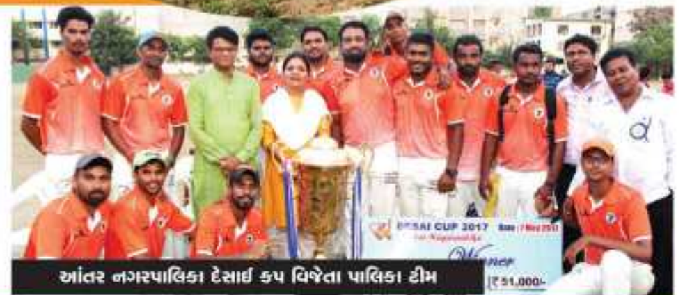
આંતર નગરપાલિકા દેસાઈ કપ વિજેતા પાલિકા ટીમ