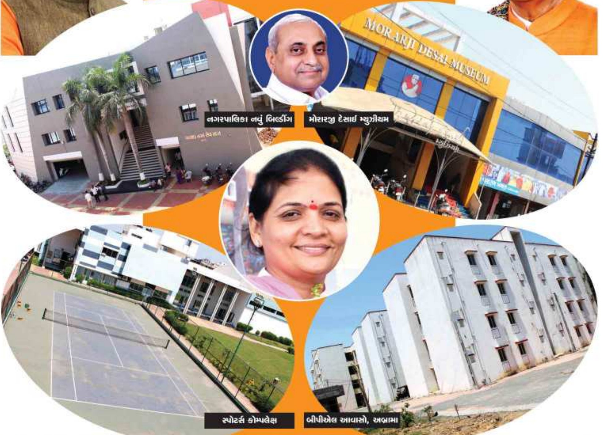
નગરપાલિકા નવું બિલ્ડીંગ