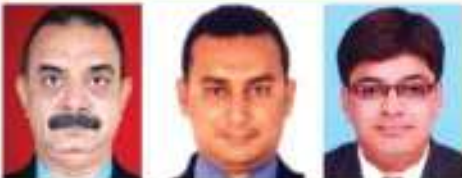
તંત્રી અમુલ દેસાઈ ફોટોગ્રાફર કાદર હાસમલી ડીઝાઈનર રાજેશ સદારેગાણી