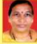
પટેલ કુલુમ કે.