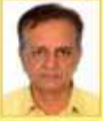
સોડીયા સલીલાંત બી.